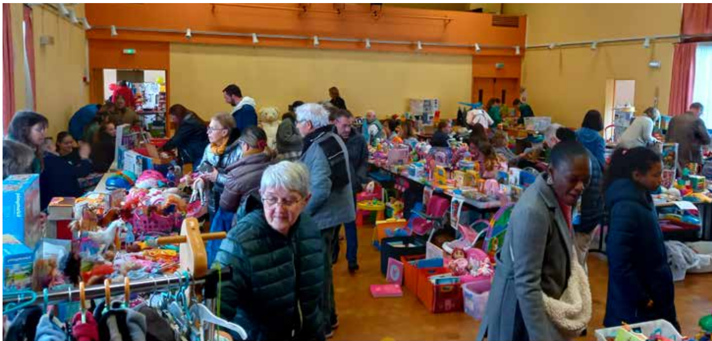
La bourse aux jouets

Cette année encore les membres des trois clubs d'amateurs de véhicules anciens, le GAVAP Auto, Chrome et Calandres et le GAVAP Moto nous ont régalié par leurs voitures de collection mais aussi par les motos et autres de roues ; le véhicule le plus ancien est de 1926, Citroën B2, couleur verte.