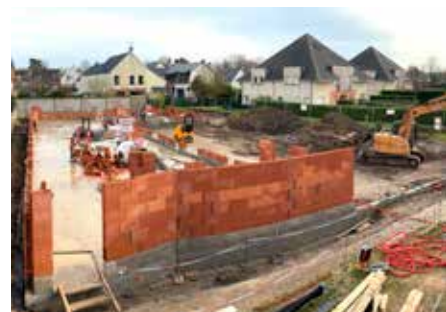
Chantier de l'ALSH (Accueil de Loisir sans Hébergement)

Nous apportons un grand nombre de services de proximité, et comme nous le faisons à Dury, réalisons des projets concrets pour améliorer le quotidien et le cadre de vie.