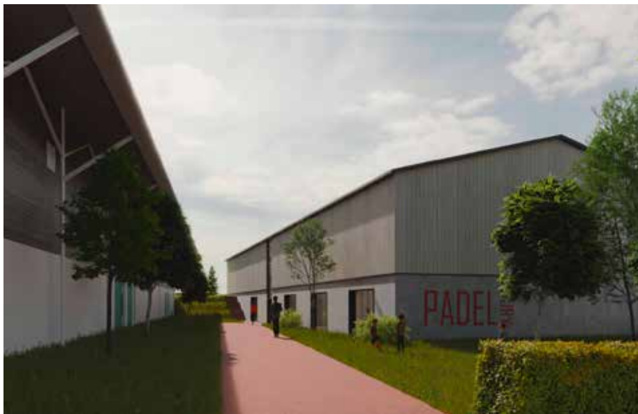
Deux terrains de padel verront bientôt le jour à proximité du terrain de tennis.

■ Les travaux de construction du nouvel Accueil de Loisirs ont débuté, la dalle de 412 m 2 sera coulée troisième semaine de janvier. Nos petits Duriens profiteront de ce nouvel espace avant la fin 2025.